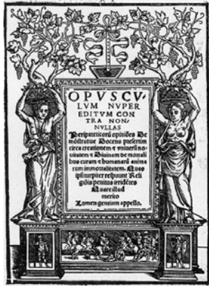
frontespizio del Lumen Gentium di R. Ovadyah Sforno (1548)

L'arco temporale è ampio: da edizioni del XVII e XVIII secolo, conservate nella sezione del "Fondo Antico", fino a opere recenti.